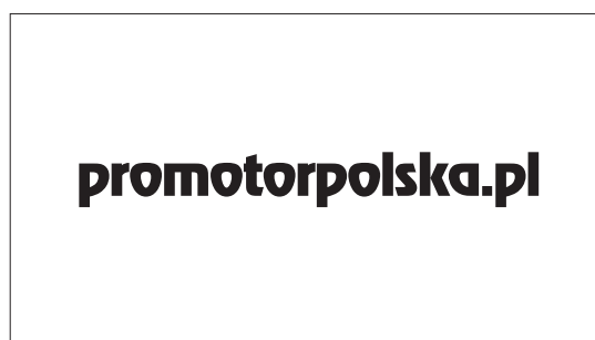
strona 2 maska